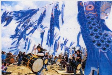
魚形凧飾・鳶型凧飾による。

青いこのぼりが舞う中、和太鼓の演奏会が開かれた。5日、宮城県東松島市、鶴山半荘撮影（2011年5月6日15時3分更新）【記事詳細】